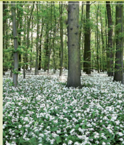
Gültig ab 9.2.2021

Infos: www.erdbuesken.de E-Mail: info@erdbuesken.de